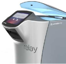
NEC ネットズエスアイ

「Relay」は米Saviioke社が開発した、自律走行型のデリバリーロボットです。人と共存することをコンセプトに開発され、仕事を助け、生産性を高めるだけでなく、人々に驚きや笑顔、新しい体験をもたらします。1日約数百回の薬剤や検体の搬送業務をRelayにまかせることで業務の効率化を図ることができます。